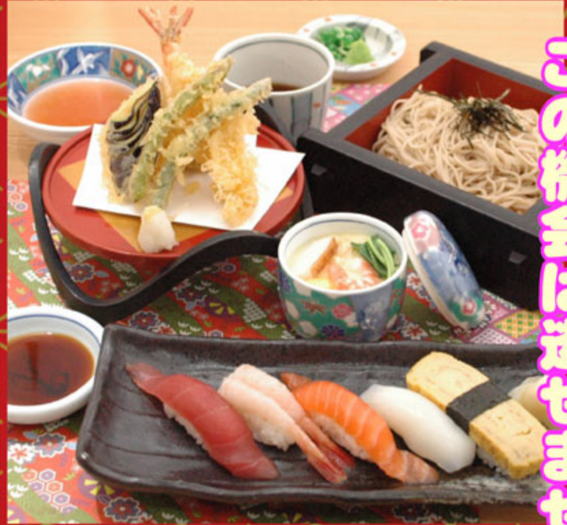
当店人気No.1 「あじ菜膳」 ¥1,449(込)