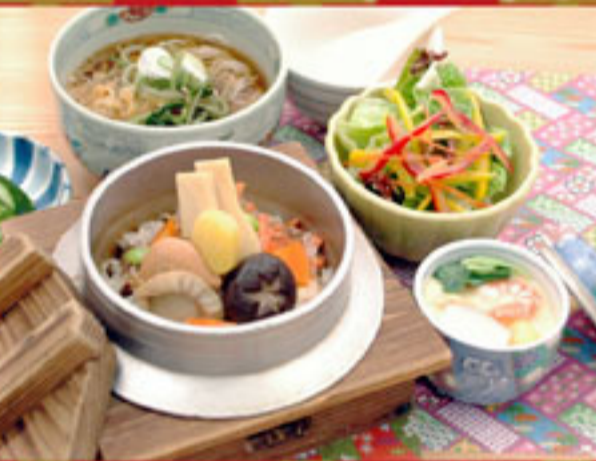
「釜飯そばセット」 ¥1,260(込)